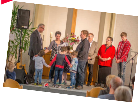
Gottesdienst mit Mitgliederaufnahme