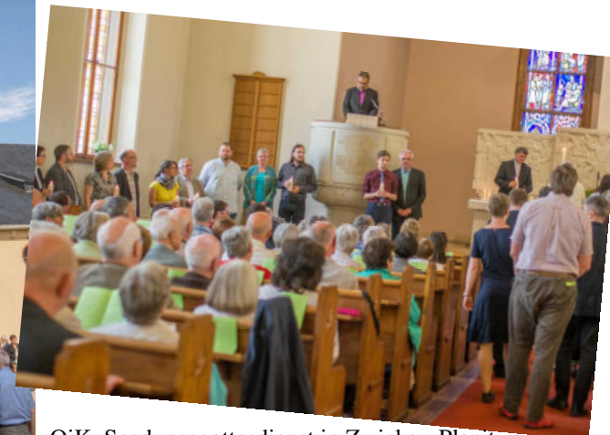
OjK Sendungsgottesdienst in Zwickau-Planitz