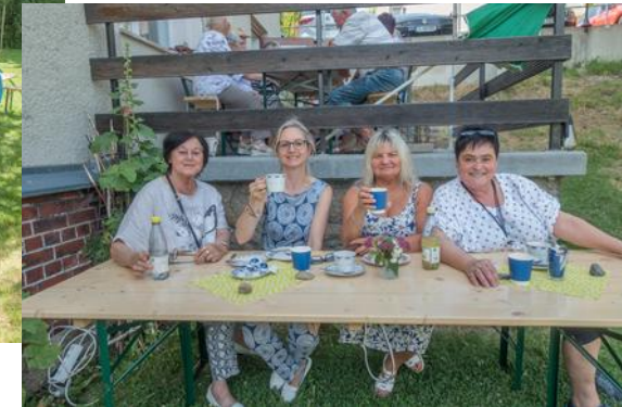
Gemeindefest am 22.06.2025