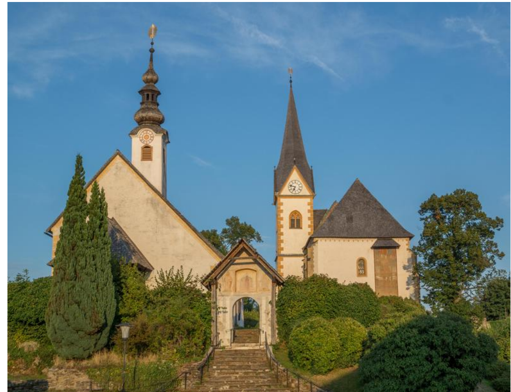
Wallfahrtskirche Maria Wörth